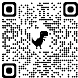
人工兌換點一覽表

前往(1)人工兌換點請現場工作人員掃描QRcode兌換自我篩檢試劑 或是(2)透過「網路訂購超商取貨」使用兌換券折抵試劑費用(須另支付運費45元)。