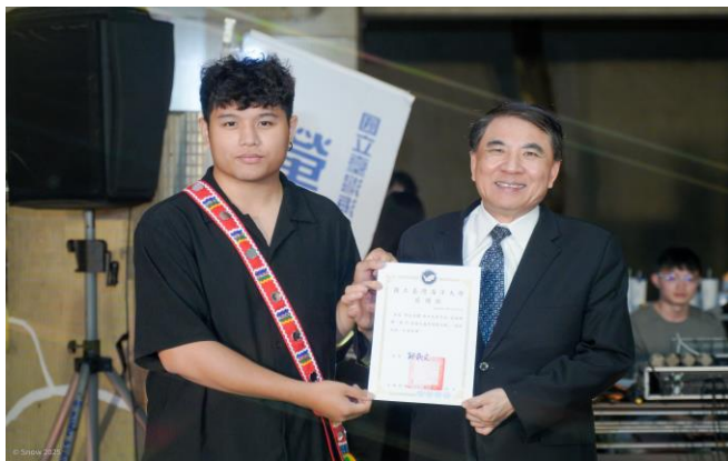
致贈感謝狀給原住民青年社