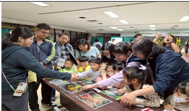
展示廳闖關活動-植物介紹