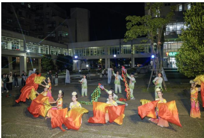
正濱國小舞蹈表演