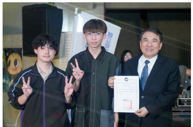
致贈感謝狀給吉他社