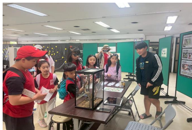
環安組環境教育活動