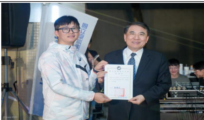
致贈感謝狀給正濱國小