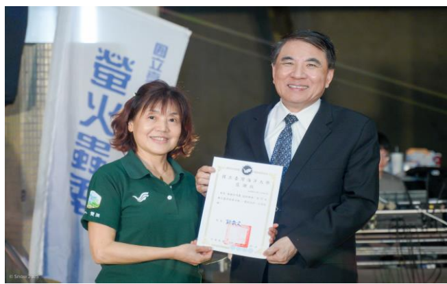
致贈感謝狀給海韻合唱團