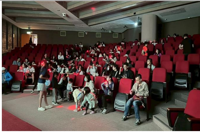
第一演講廳賞螢注意事項介紹