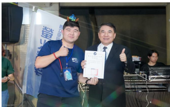
致贈感謝狀給攝影社