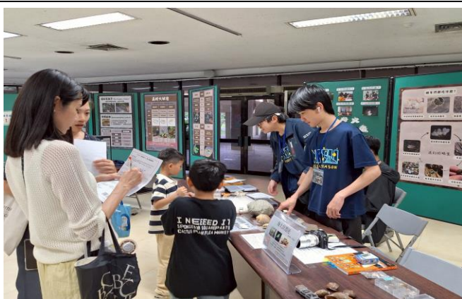
展示廳闖關活動-貝殼介紹