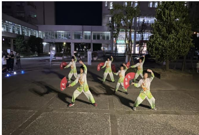
正濱國小扇子表演