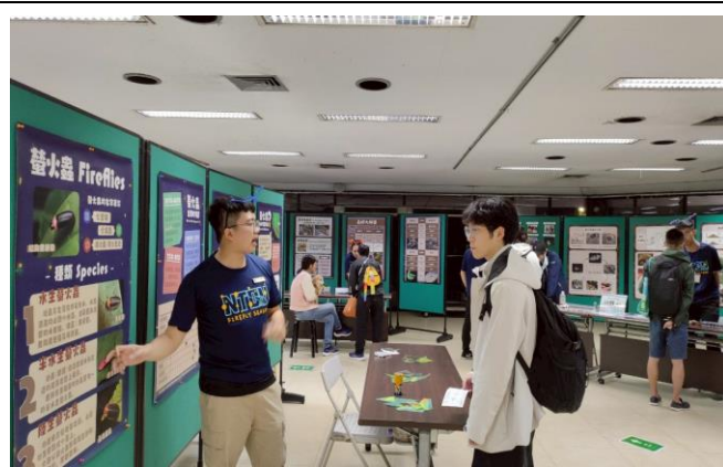
展示廳闖關活動-螢火蟲介紹