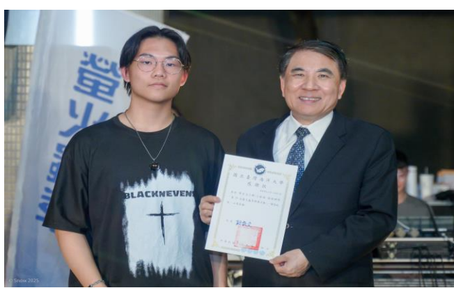
致贈感謝狀給工程組