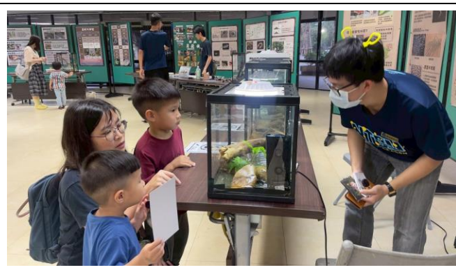
展示廳闖關活動-青蛙介紹