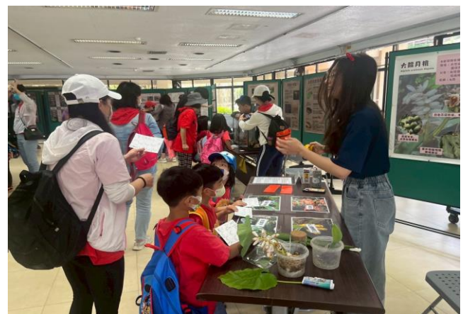
環安組環境教育活動