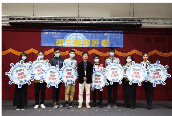
學系性社團得獎社團合影