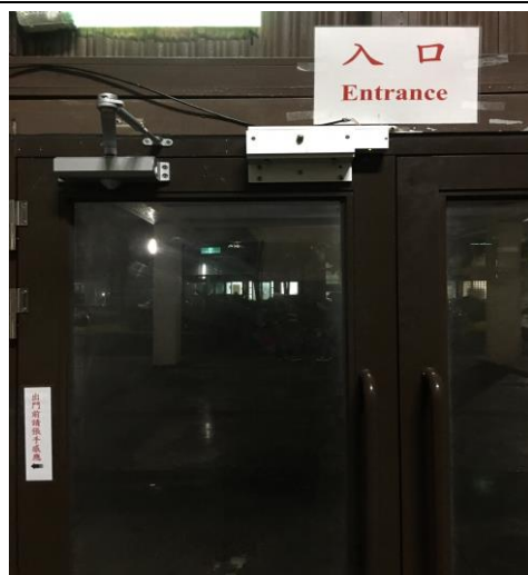
四、出口處關閉後由入口處離開