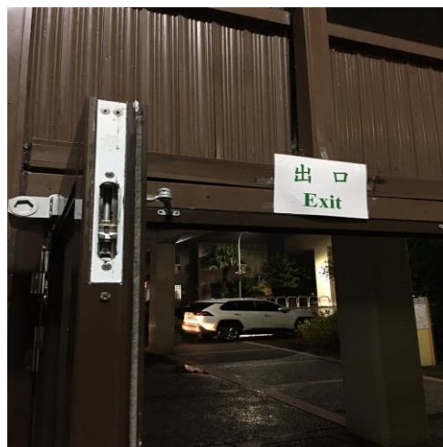
二、活動結束離開前先關閉出口處左側門，並扣上門閂