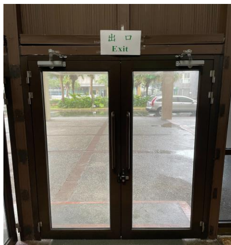
一、活動辦理由出口處進出

行政大樓一樓大門每日晚間 19 時關閉，可暫時開啟出口處進出，活動辦理結束後需關閉出口處之大門，並由入口處感應門鎖控制器開門離開