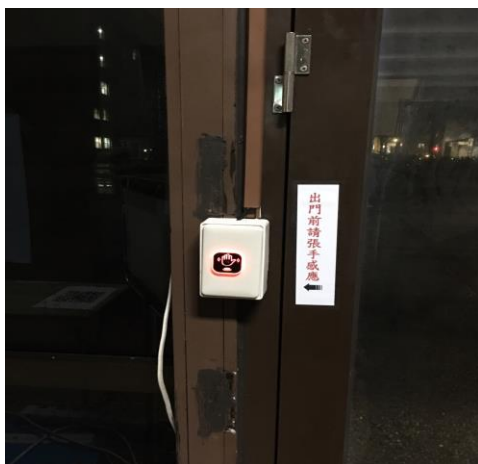
五、感應門鎖控制器開門後離開行政大樓