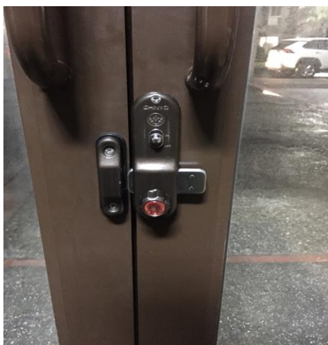
三、再將出口處右側門關閉，並上鎖