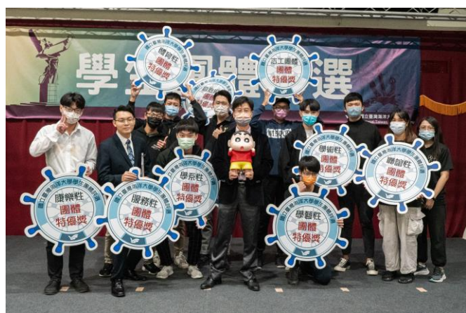
團體特優獎得獎社團合影