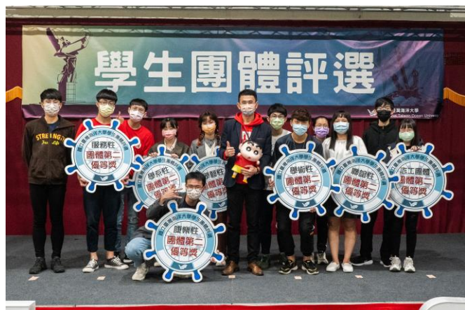
團體第二等獎得獎社團合影