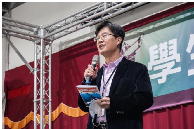
閉幕式學務長致詞勉勵