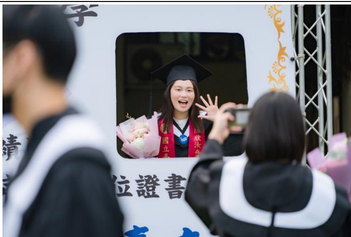
畢業生開心地拍照留念