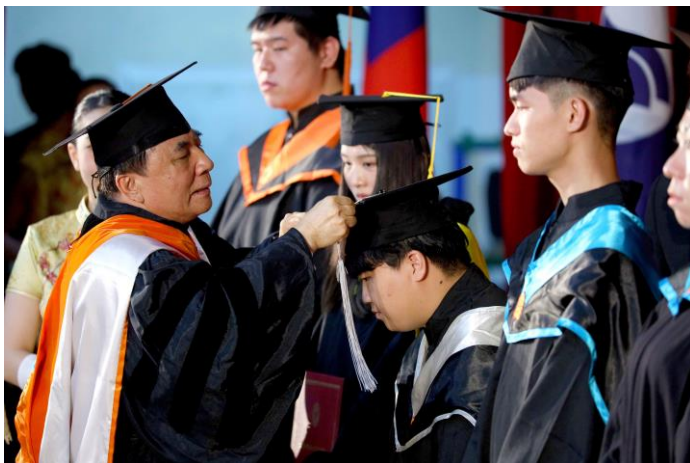
校長為畢業生正冠