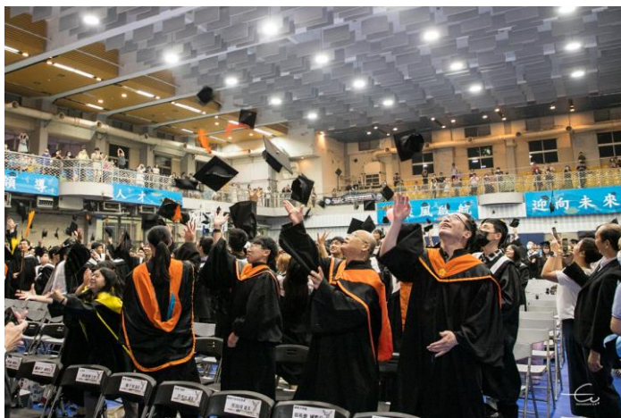
畢業生帶著滿滿回憶拋學位帽慶賀