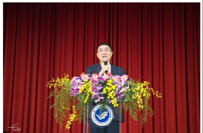
謝國樑市長希望未來基隆市可以跟海大共同成長共同學習