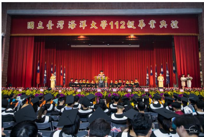
海大 112 級畢業典禮 期勉學子乘風破浪勇往前行