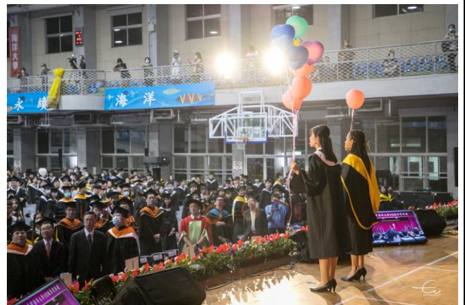
本屆畢業典禮亮點之畢業生代表創意出場及領唱校歌