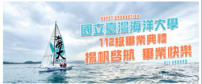
校網首頁 banner 祝賀全體畢業生 「揚帆啟航畢業快樂」 (媒體公關暨出版中心製)