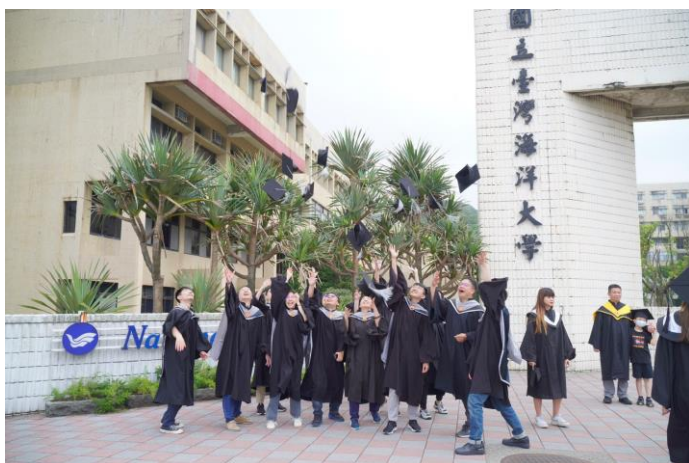
畢業生們於校門前拋帽慶賀完成學業