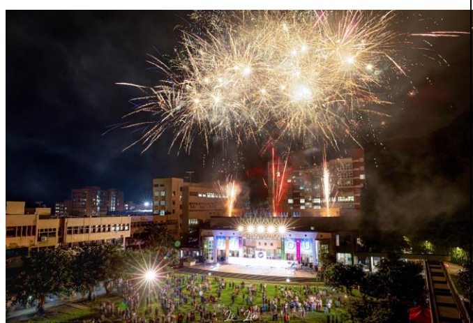
畢業生們在燦爛的煙火下邁向似錦前程、揚帆 啟航