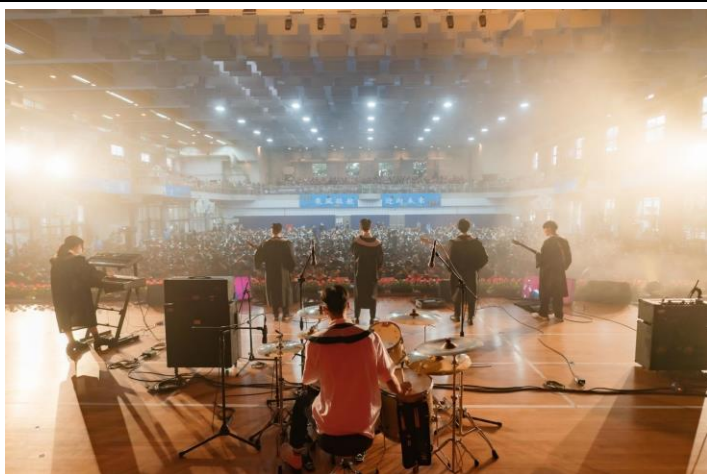
暖場活動-熱音社歌曲串燒表演