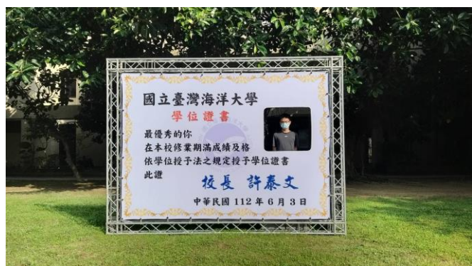
本屆畢典亮點之創意拍照裝置-1 地點:X 型廣場