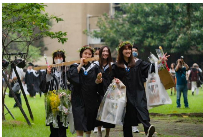
畢業生們聚集於X型廣場拍照氣氛熱鬧愉悅