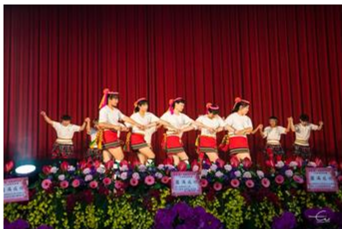
暖場活動-原手社同學表演阿美族創新原民舞蹈歌曲「披上情人袋」獻上對畢業生滿滿的祝福