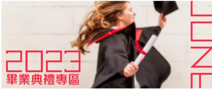
校網首頁-畢典專區 (媒體公關暨出版中心製)