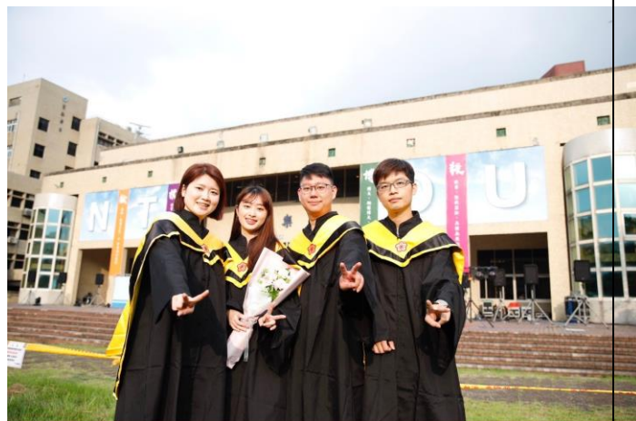
畢業生們於畢典會場前開心合影