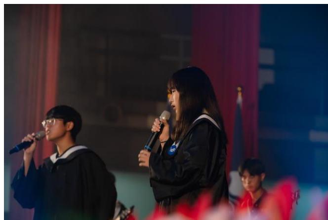
暖場活動-畢聯會演唱本屆畢業歌曲 《再見以前》