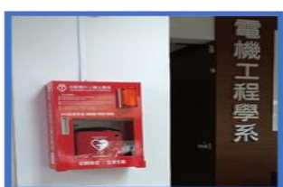
電機一館 1 樓