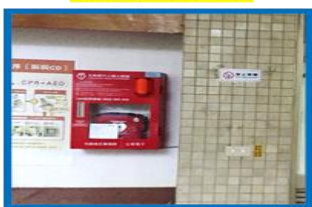
育樂館 1 樓