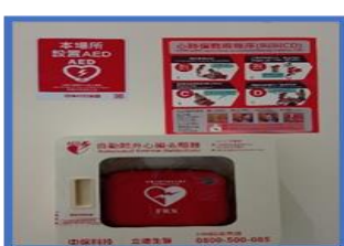
電資綜合一館 1 樓