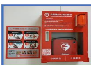
生科院館 1 樓