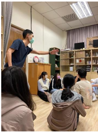
成員分享 MV 感受