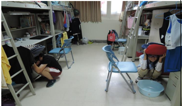
逃生疏散和避難的演練