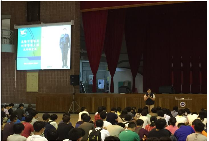
基隆市刑事警察大隊反詐騙宣導活動