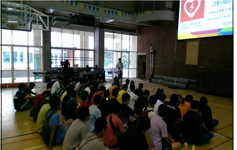
紅十會古逸軒教官上課情形