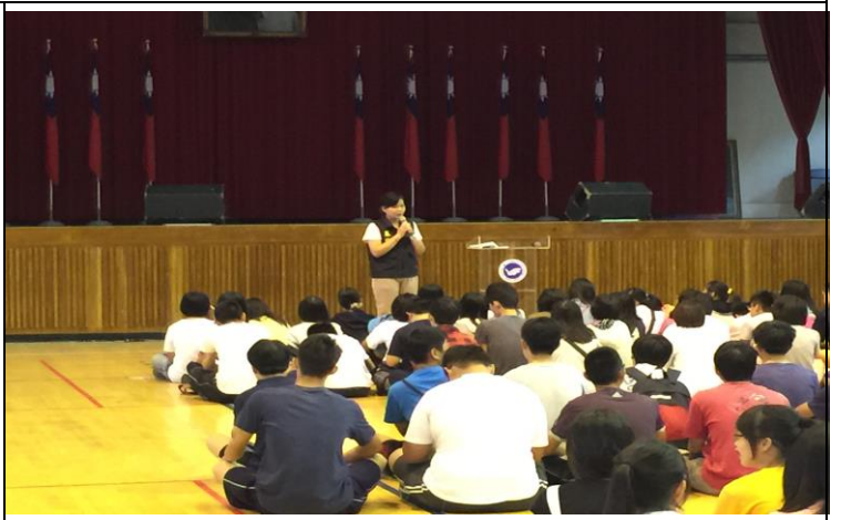
防災安全觀念與常識宣導