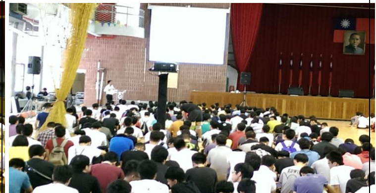
紅十會古逸軒教官上課情形(AED、CPR 介紹)