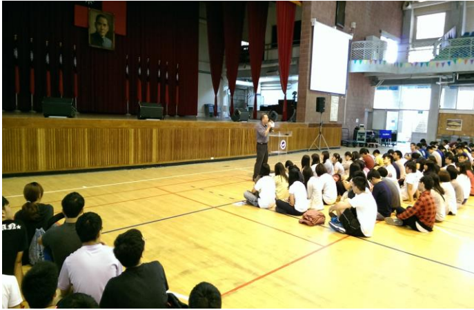
軍訓室主任親自指導說明防災演練