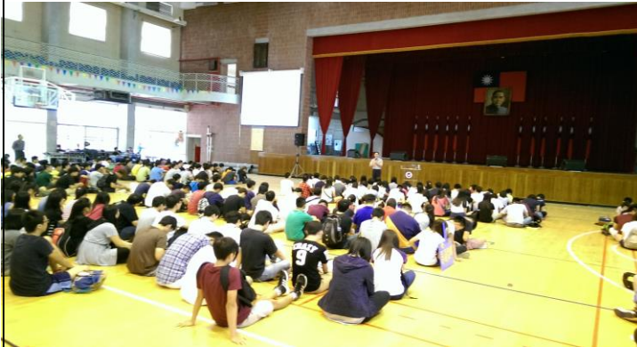
交通安全教育宣導