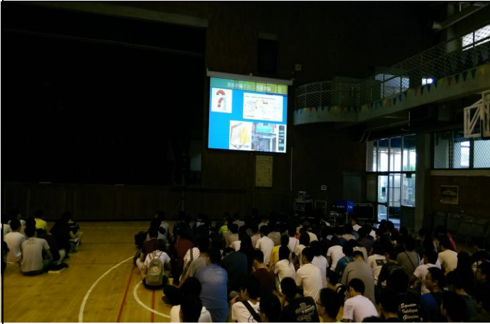
防災安全觀念與常識宣導