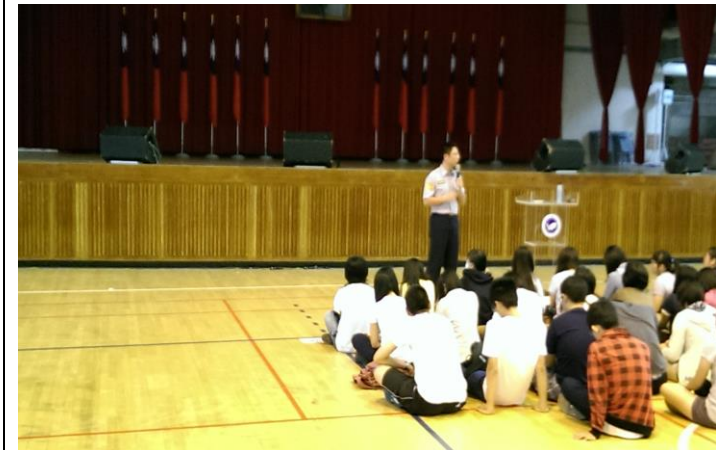
交通安全教育宣導