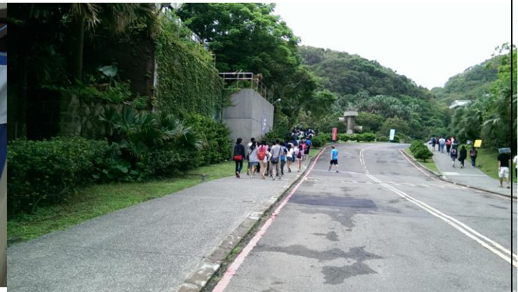
逃生疏散和避難的演練