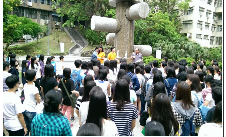
軍訓室主任對同學實施演練後說明