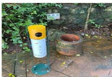
男一舍對面山邊平台空地

Balcony on the 2nd floor of Administration Building