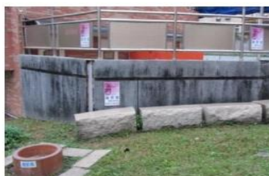
游泳運動中心旁空地

Balcony on the 5th floor of Dept. of Merchant Marine