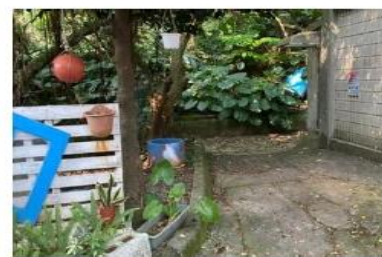
海事大樓丙棟後側(養殖溫室)空地

Hillside open space opposite the Men's Dorm 1