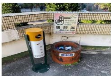
行政大樓 2 樓外陽台

Balcony on the 2nd floor of Administration Building