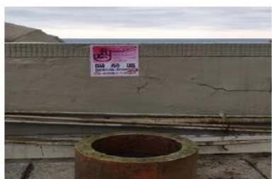
機械、商船系館 5 樓外陽台

Open space behind the Marine Science Building C