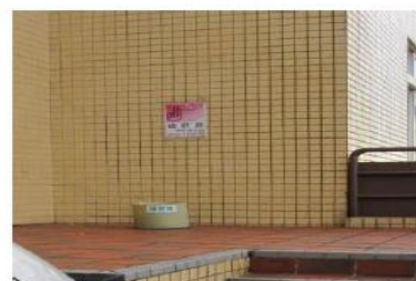
電機二館後側空地

Open space next to the Sports Center (Swimming Pool)